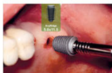
Установка имплантата диаметром 5,0 мм