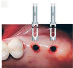
Минимальная травма - формирование ложа трепаном 3,5 мм

МИНИМАЛЬНАЯ ТРАВМА КОСТИ МАКСИМАЛЬНОЕ СОХРАНЕНИЕ КОСТНОЙ ТКАНИ