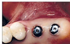
Хорошая первичная стабилизация позволяет сразу фиксировать формирователи десны